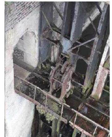
Vue du treuil sur la passerelle du cadre

Le cadre en place serait accompagné de panneaux didactiques relatant l'histoire de l'ouvrage, les manœuvres et son fonctionnement.